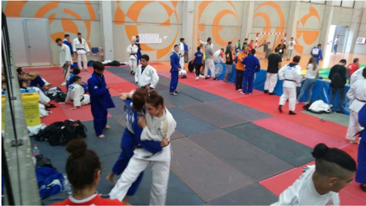
Zona de calentamiento