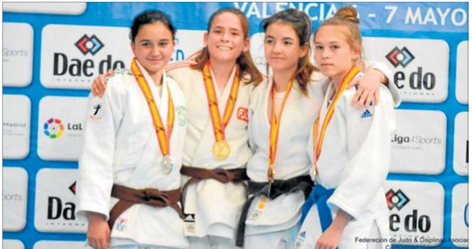
La Federación anima a niños y jóvenes a practicar judo en un centro federado con el lema «Atrévete a ser cinturón negro».