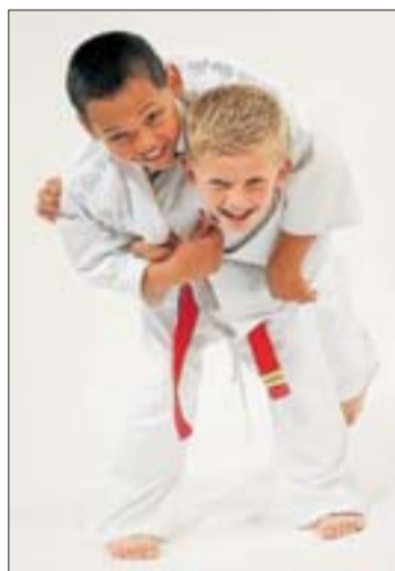
Judo para niños. SD