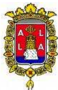
AYUNTAMIENTO DE ALICANTE