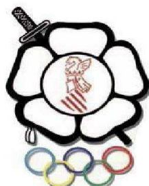
FEDERACION DE JUDO COMUNIDAD VALENCIANA Y D. A.